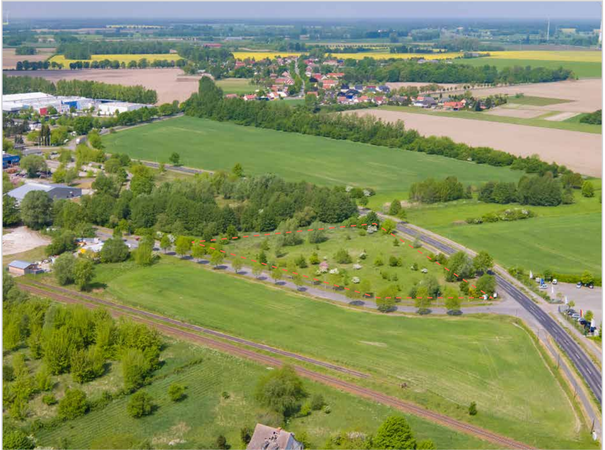
Baufeld 21 - Luftbild