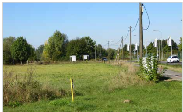
Baufeld 23 - Blick von der Temnitz-Park-Chaussee