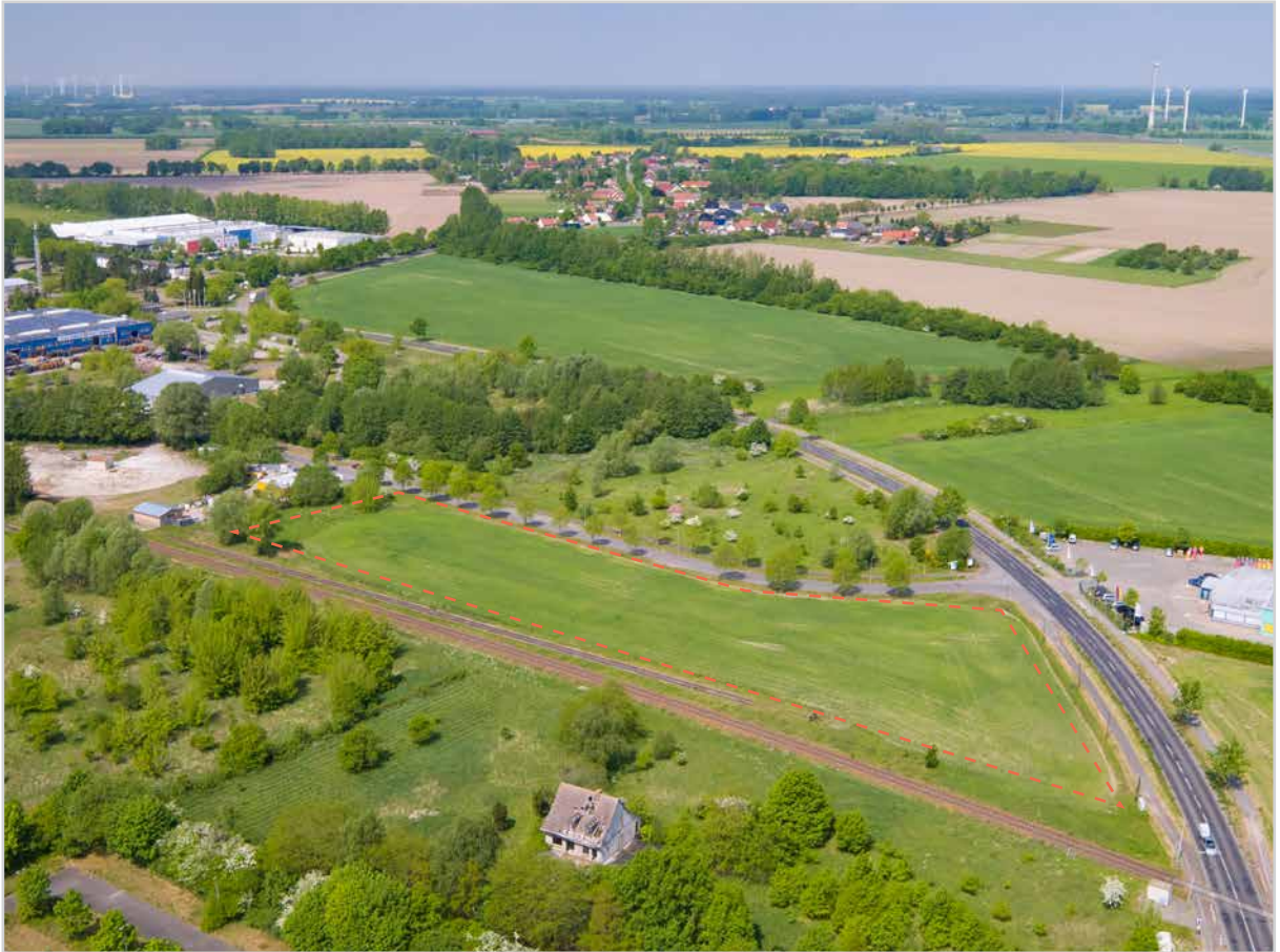
Baufeld 23 - Luftbild