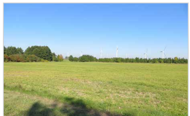
Baufeld 34.2 - Blick von der Temnitz-Park-Chaussee