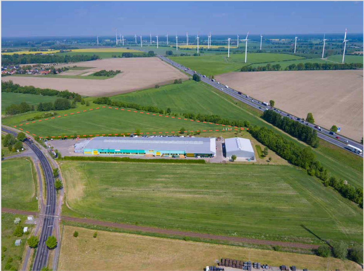
Baufeld 34.2 - Luftbild