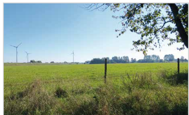
Baufeld 36 - Blick von der Temnitz-Park-Chaussee