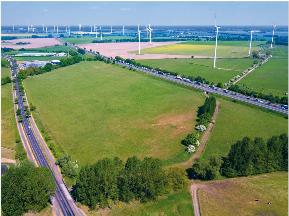
Baufeld 36 - Luftbild