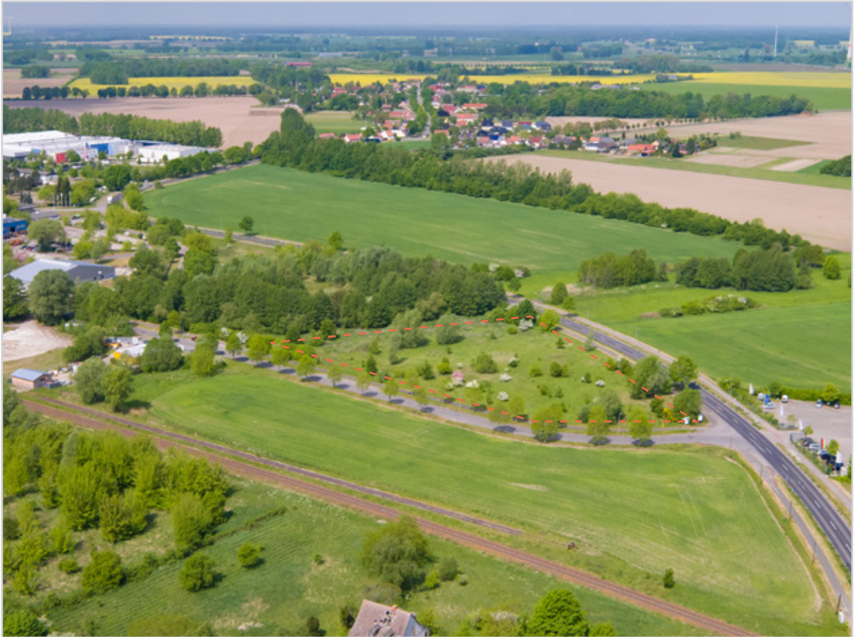
Baufeld 21 - Luftbild