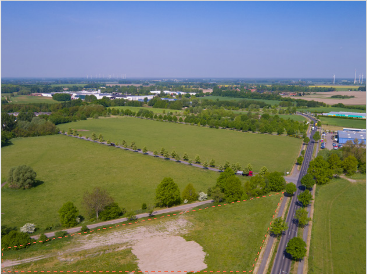
Baufeld 47 - Luftbild