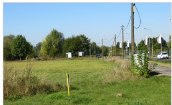
Baufeld 23 - Blick von der Temnitz-Park-Chaussee