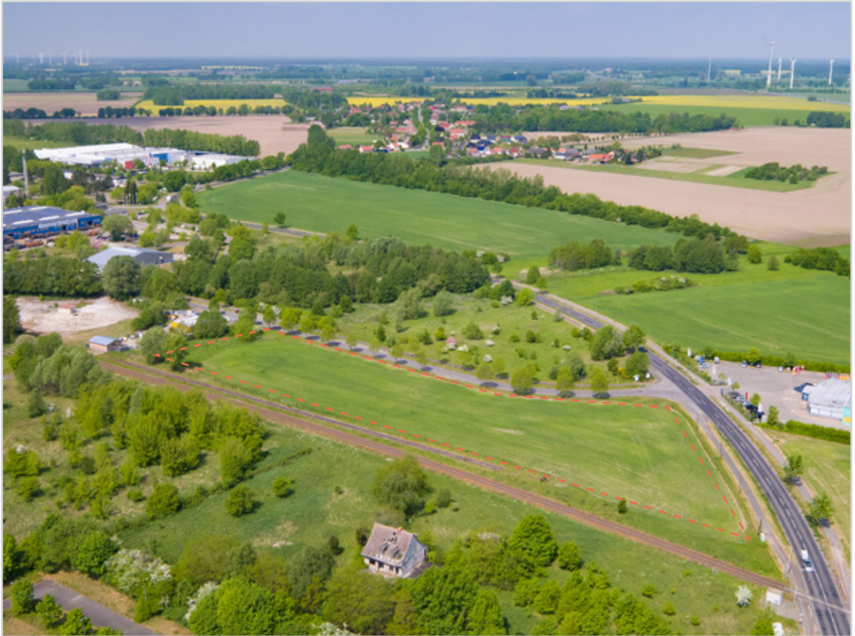
Baufeld 23 - Luftbild