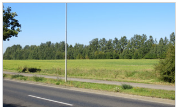
Baufeld 33 - Blick von der Temnitz-Park-Chaussee