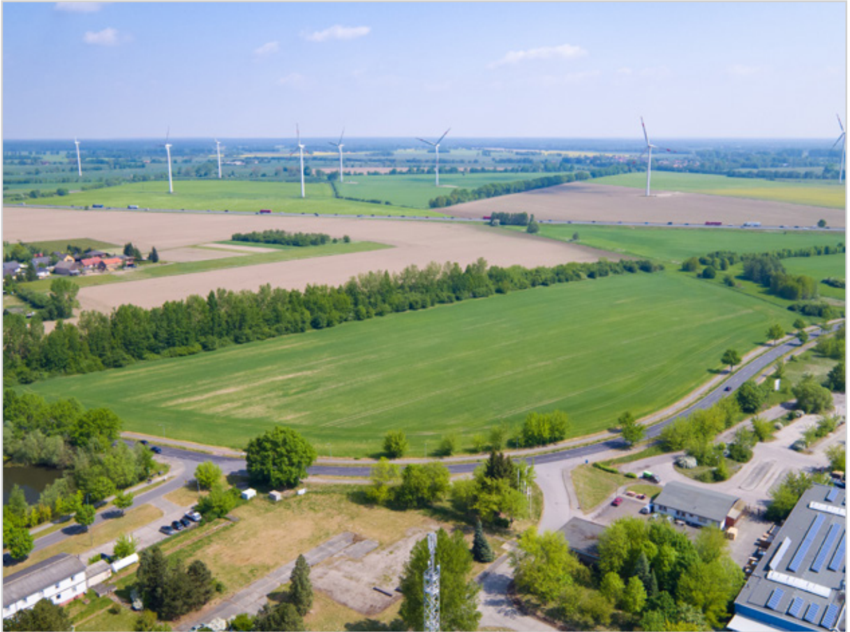
Baufeld 33 - Luftbild