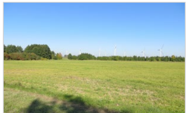
Baufeld 34.2 - Blick von der Temnitz-Park-Chaussee