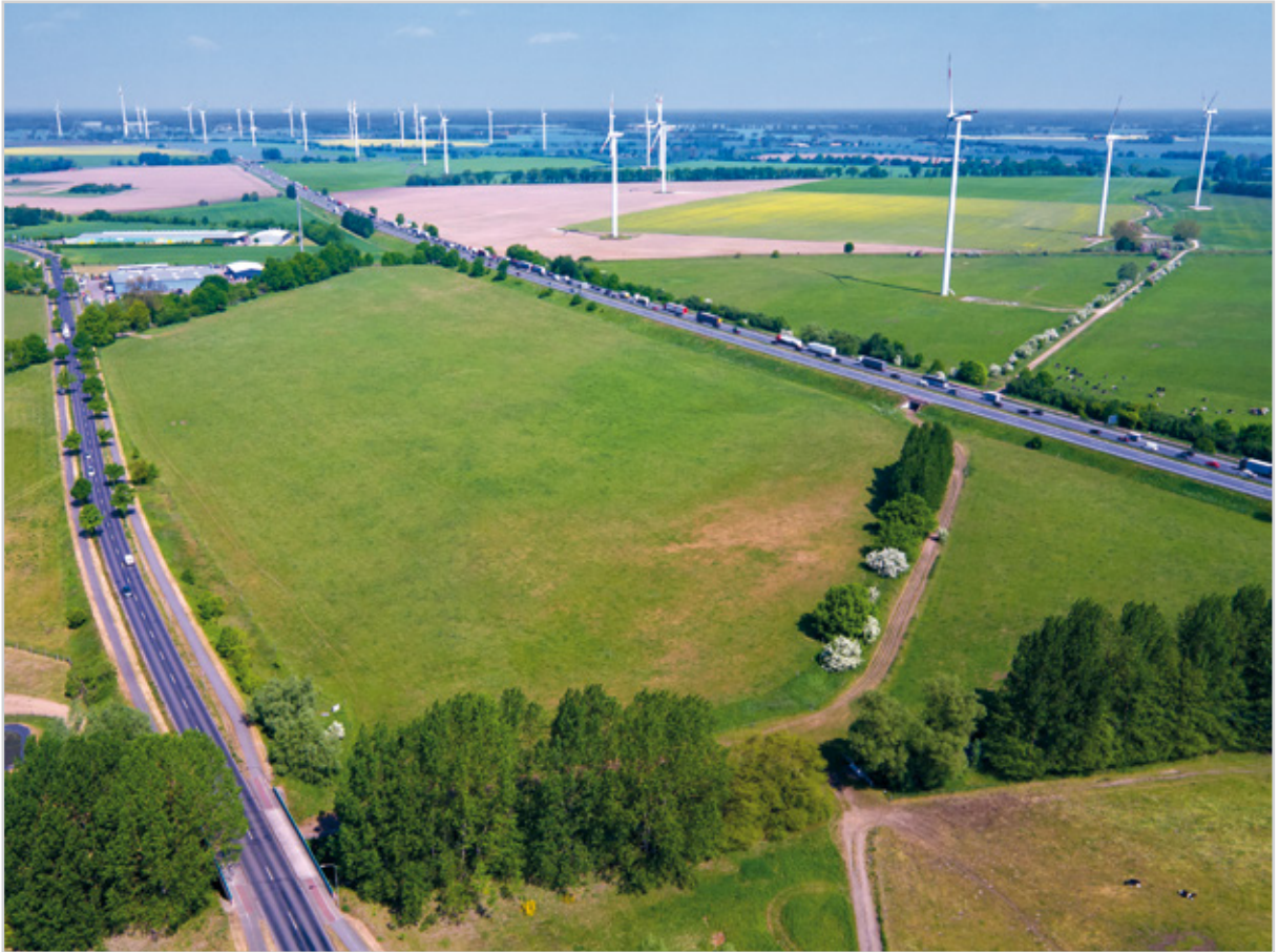
Baufeld 36 - Luftbild