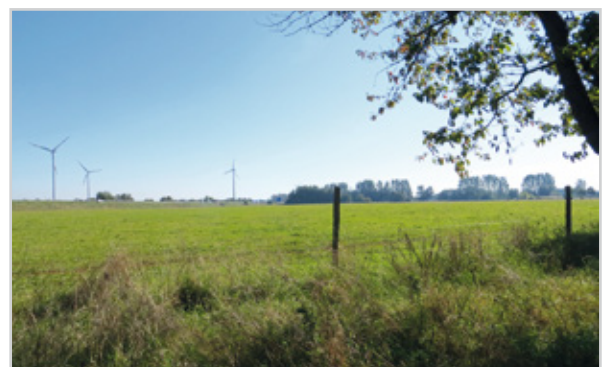
Baufeld 36 - Blick von der Temnitz-Park-Chaussee