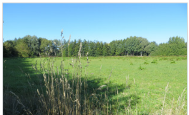
Baufeld 44 - Blick von der Lindenallee