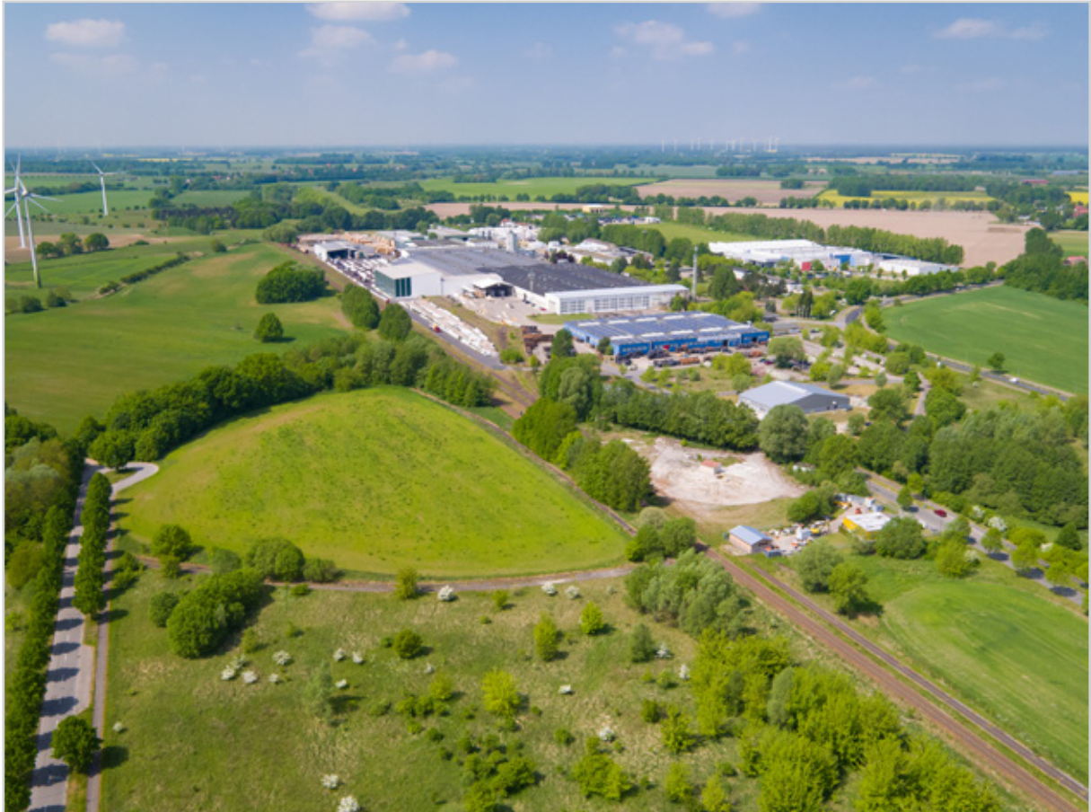
Baufeld 44 - Luftbild