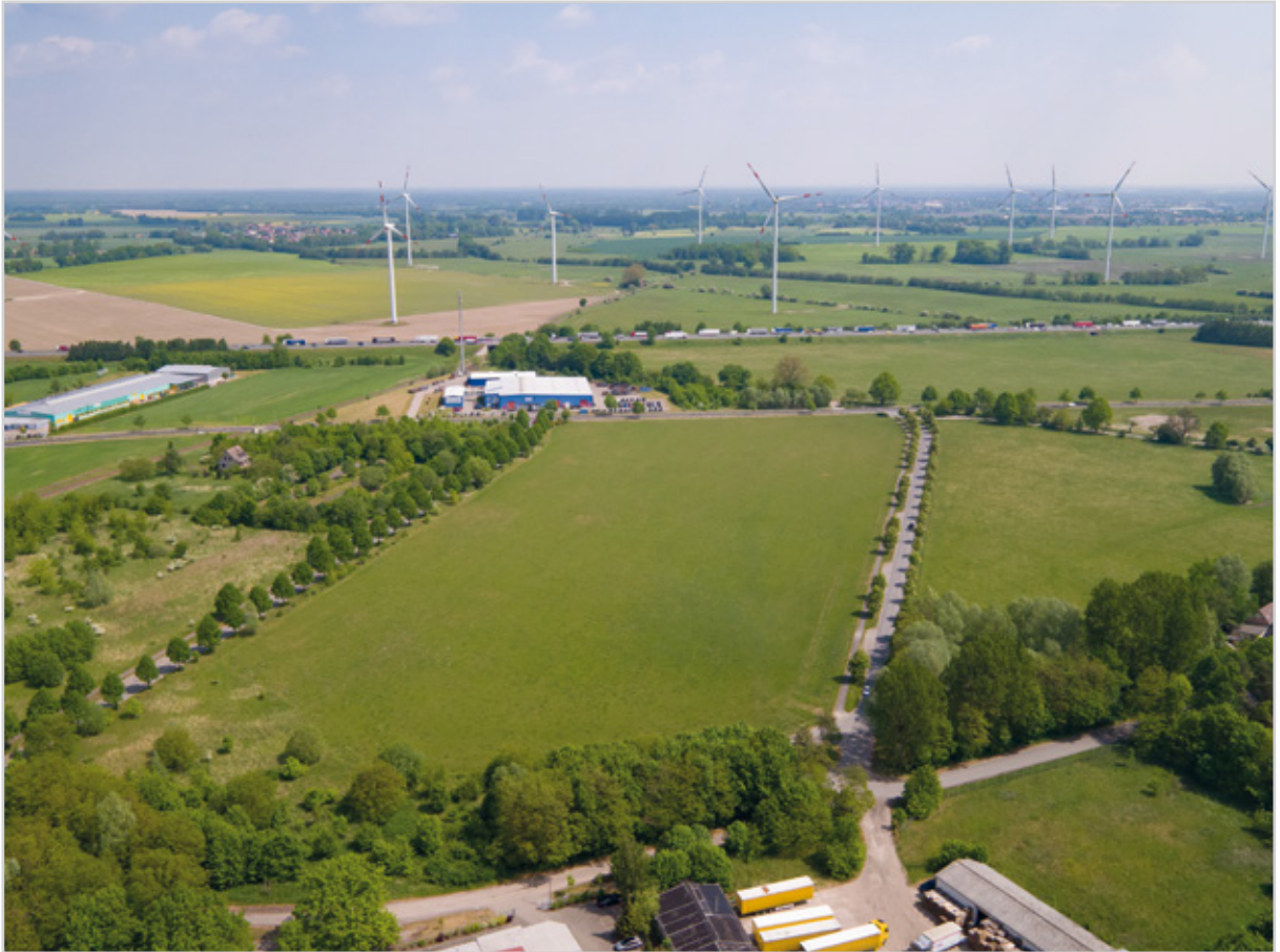
Baufeld 45 - Luftbild