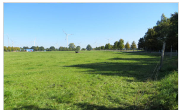
Baufeld 45 - Blick von der Kastanienallee