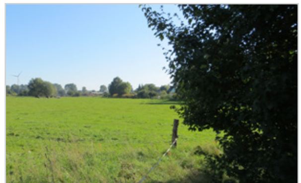
Baufeld 46 - Blick von der Kastanienallee