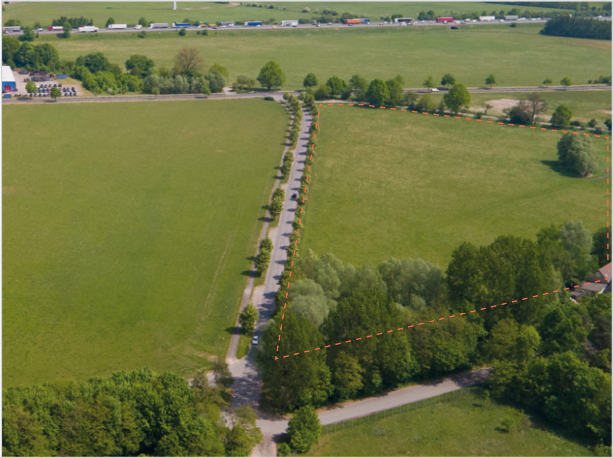
Baufeld 46 - Luftbild