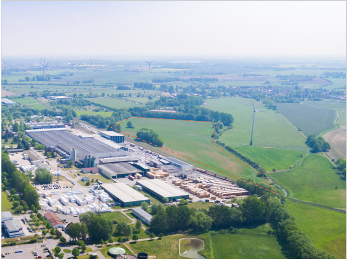
Baufeld 51 - Luftbild