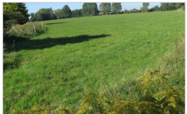
Baufeld 61 - Blick von der Temnitz-Park-Chaussee