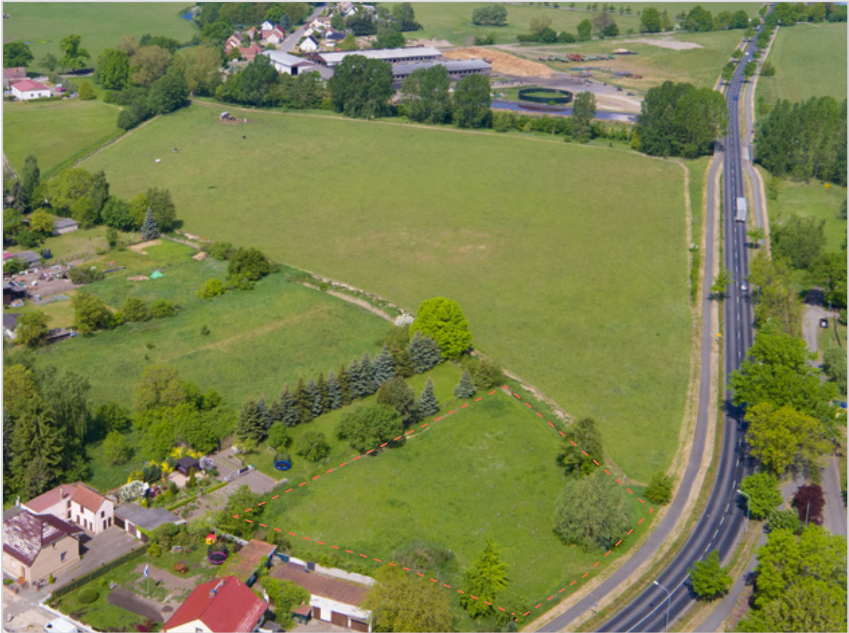
Baufeld 61 - Luftbild