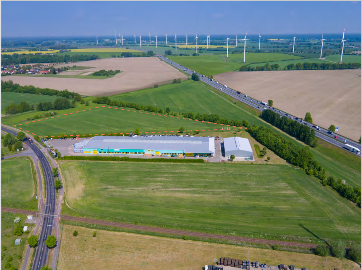
Baufeld 34.2 - Luftbild