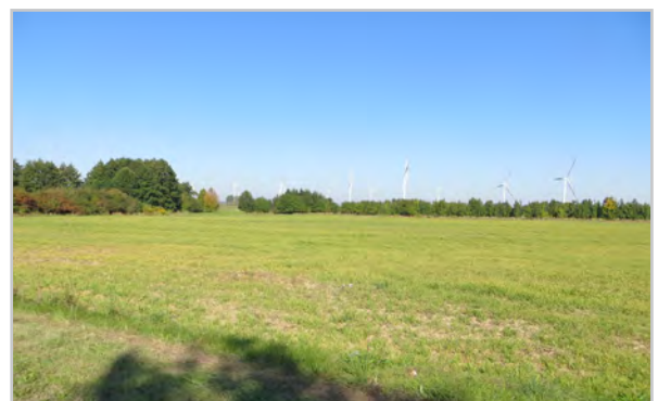
Baufeld 34.2 - Blick von der Temnitz-Park-Chaussee