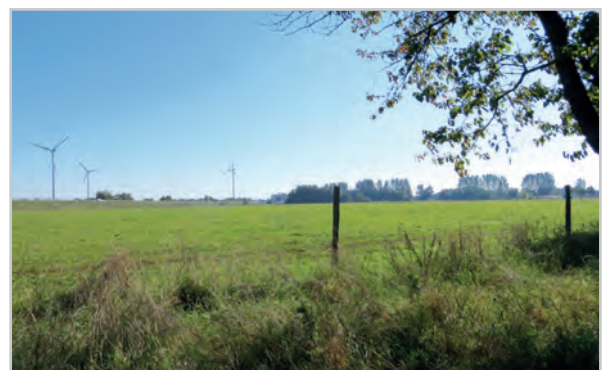
Baufeld 36 - Blick von der Temnitz-Park-Chaussee