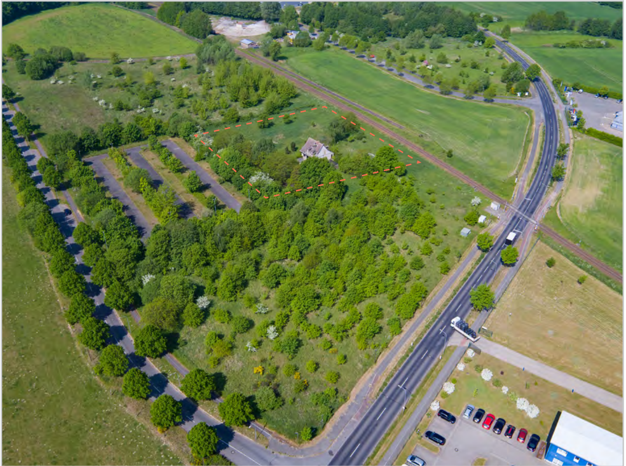
Baufeld 42 - Luftbild