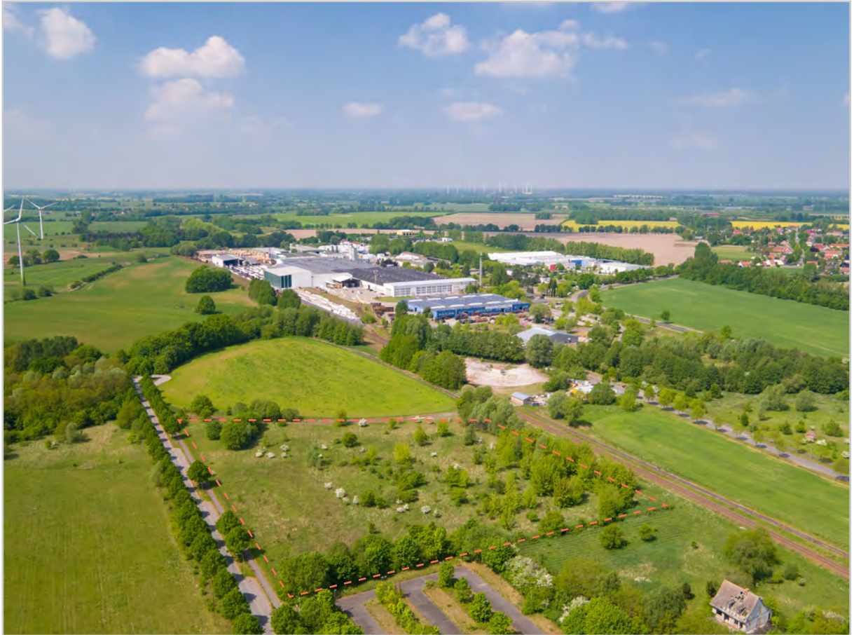
Baufeld 43 - Luftbild