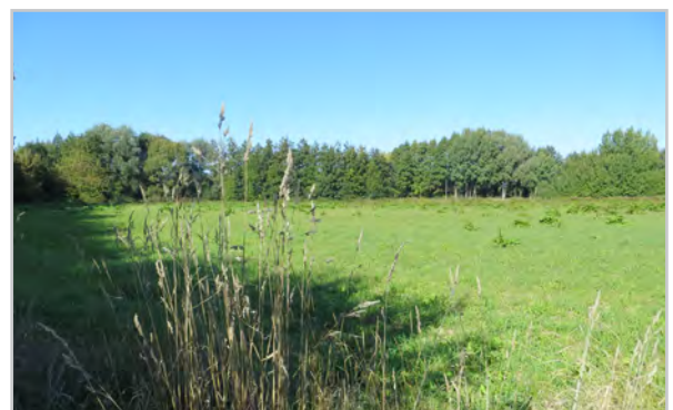
Baufeld 44 - Blick von der Lindenallee