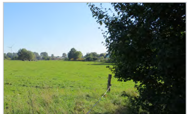
Baufeld 46 - Blick von der Kastanienallee