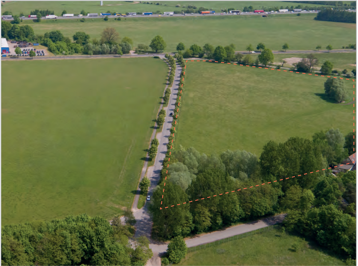
Baufeld 46 - Luftbild